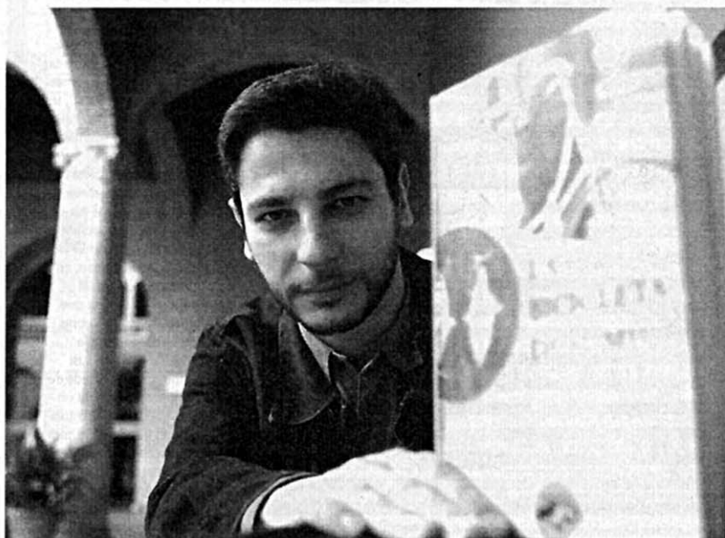
PEÑA-TORO. El autor muestra uno de los ejemplares de 'La bicicleta de Sumji'.