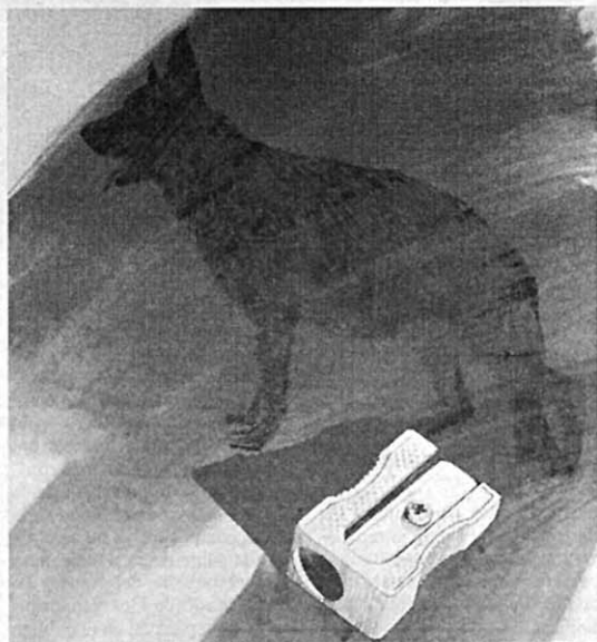
TRADICIÓN. El blanco y negro caracteriza algunas ilustraciones.